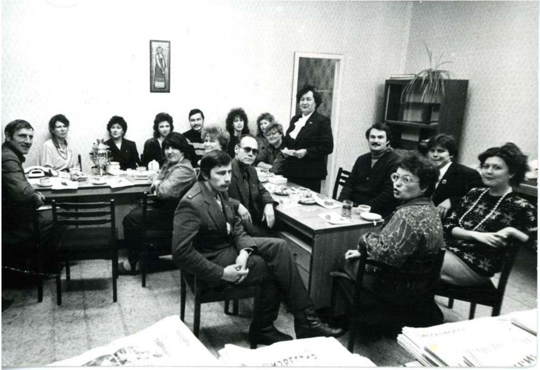
Коллектив «Челнинских известий» вместе и в будни, и в праздники